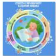
СЕКРЕТЫ ГАРМОНИЧНО ГО РАЗВИТИЯ РЕБЕНКА