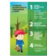
ПРАВИЛА ПОВЕДЕНИЯ В ЛЕСУ