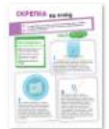
СКРЕПКА НА ПЛАВУ