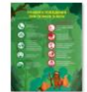
ЧТО ДЕЛАТЬ ПРИ ПОЖАРЕ В ЛЕСУ