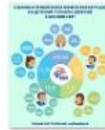
ДЕТСКИЙ ТЕЛЕФОН ДОВЕРИЯ