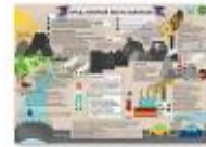
ВРЕД КОТОРЫЙ МЫ НЕ ЗАМЕЧАЕМ