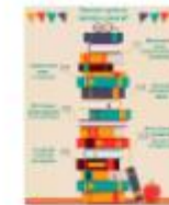
ЗАЧЕМ ЧИТАТЬ КНИГИ