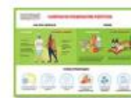
ПРОФИЛАКТИ КА ПЕРЕГРЕВА