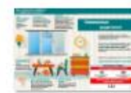
КАК ЗАЩИТИТЬ РЕБЕНКА ОТ ПАДЕНИЯ И...