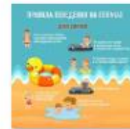
ПРАВИЛА ПОВЕДЕНИЯ НА ПЛЯЖЕ