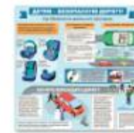
ДЕТЯМ БЕЗОПАСНУЮ ДОРОГУ