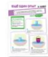
ОПЫТ В ВАННЕ