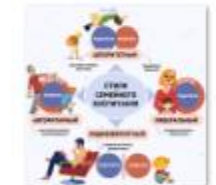
СТИЛИ СЕМЕЙНОГО ВОСПИТАНИЯ