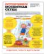
ОСТОРОЖНО, МОСКИТНАЯ СЕТКА