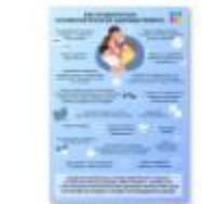
ПСИХОЛОГИЧ ЕСКОЕ ЗДОРОВЬЕ РЕБЕНКА