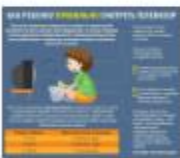
КАК ПРАВИЛЬНО СМОТРЕТЬ ТЕЛЕВИЗОР