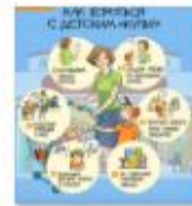
КАК БОРЬТЬСЯ С ДЕТСКИМ КУПИ