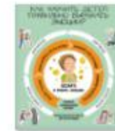
КАК НАУЧИТЬ РЕБЕНКА ПРАВИЛЬНО ВЫРАЖАТЬ Э...