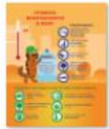
БЕЗОПАСНОСТЬ В ЖАРУ