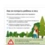
КАК НЕ ПОТЕРЯТЬ РЕБЕНКА В ЛЕСУ