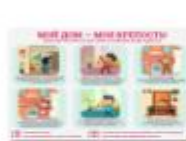
МОЙ ДОМ МОЯ КРЕПОСТЬ