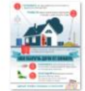
КАК УБЕРЕЧЬ ДАЧУ ОТ ПОЖАРА