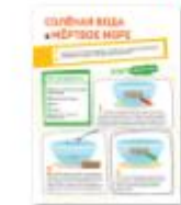
СОЛЕНАЯ ВОДА И МЕРТВОЕ МОРЕ