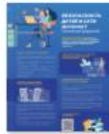
БЕЗОПАСНОСТЬ В ИНТЕРНЕТЕ