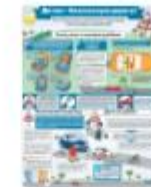
ЕСЛИ У ВАС В МАШИНЕ РЕБЕНОК