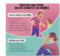
КАК НЕ СРЫВАТЬСЯ НА РЕБЕНКЕ