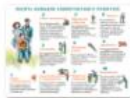
НАВЫКИ КОМПЕТЕНТ НОГО РОДИТЕЛЯ