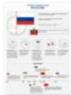
ГОСУДАРСТВЕ ННЫЙ ФЛАГ РОССИИ