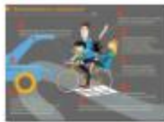
ВЕЛОСИПЕДИ СТУ ЗАПРЕЩЕНО