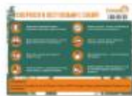
СОБРАЛСЯ В ЛЕС. ВОЗЬМИ С СОБОЙ