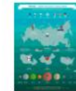
РОССИЯ САМАЯ БОЛЬШАЯ СТРАНА