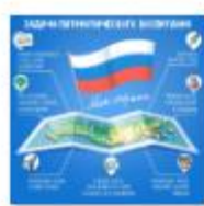
ЗАДАЧИ ПАТРИОТИЧЕС КОГО ВОСПИТАНИЯ