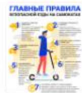
ПРАВИЛА ЕЗДЫ НА ЭЛЕКТРОСАМ ОКАТАХ