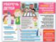
КАК УБЕРЕЧЬ РЕБЕНКА