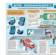
КАК ОБЕЗОПАСИТЬ МАЛЕНЬКОГО ПАССАЖИРА