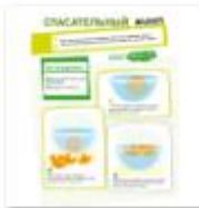
СПАСАТЕЛЬНЫ Й ЖИЛЕТ