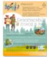
БЕЗОПАСНЫЙ ПОХОД В ЛЕС