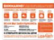
ЛИЗААЛЕРТ ЧТО ДЕЛАТЬ ЕСЛИ ЗАБЛУДИЛС...