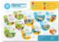
15 НЕБАНАЛЬНЫХ СОВЕТОВ