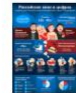
РОССИЙСКОЕ КИНО В ЦИФРАХ