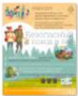
БЕЗОПАСНЫЙ ПОХОД В ЛЕС