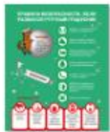
ЕСЛИ РАЗБИЛСЯ РТУТНЫЙ ГРАДУСНИК